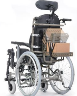
Wózek na zdjęciu wyposażony w półkę na respirator - opcja.