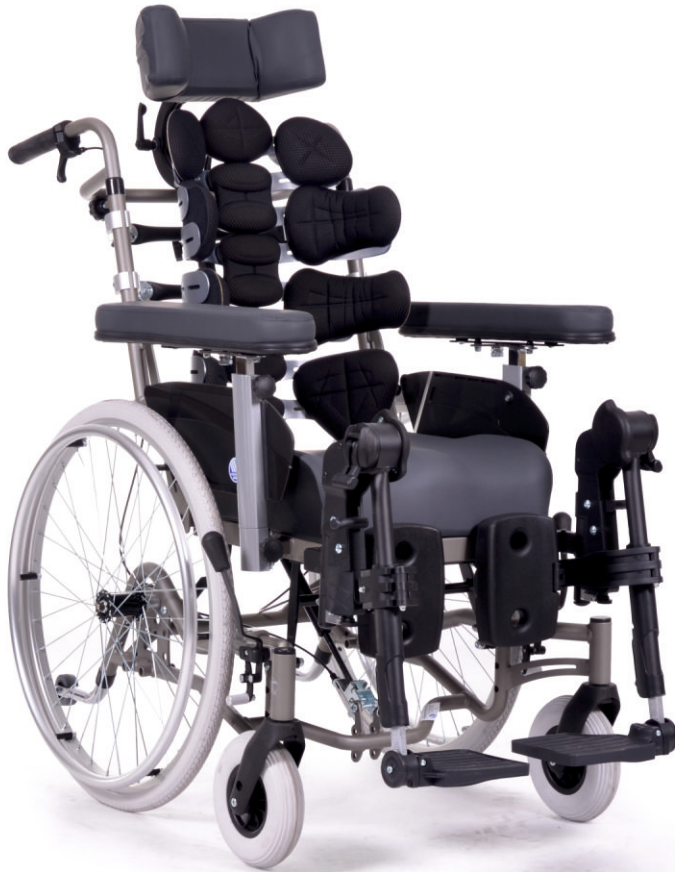
Wózek na zdjęciu wyposażony w oparcie ortopedyczne TARTA®-opcja.