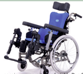
Wózek wyposażony w gorset Comfortable Duo Plus-opcja.