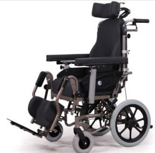
Wózek na zdjęciu wyposażony w koła transportowe - opcja.